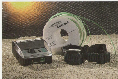
Cod. CA25 centralina, collare, 100 metri di filo Cod. CA26 collare aggiuntivo Cod. CR26 bobina 100 mt. di filo

Oltre il manuale d'istruzioni viene fornito un DVD con i consigli pratici per l'uso e la messa in opera del recinto elettronico CANIFUGUE.