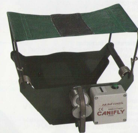
Cod. CA11 CANIFLY 1500 solo gabbia lancia volatili Cod. CA12 CANIFLY 1500 + telecomando 1500 PRO