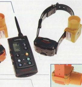
Canibeep Radio Pro: pag 18