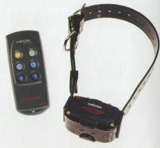
Cod. CA02F telecomando con 1 collare Cod. CR03 solo collare Cod. CR04F solo telecomando

Le caratteristiche dei collari sono le stesse per tutti i telecomandi della gamma CANICOM.