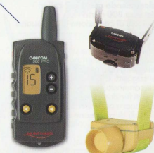
Cod. CA04 telecomando con 1 collare e 1 CANIBEEP RADIO PRO Cod. CR03 solo collare addestramento Cod. CA14G solo CANIBEEP RADIO PRO Cod. CR04X solo telecomando

La portata di 500 metri è ideale per tenere sotto controllo l'ausiliare in tutte le situazioni di caccia pratica. Funzioni del telecomando con display LCD: • bip sonoro di preavviso per allertare il cane; • 15 livelli di correzione; • stimolazione flash / continua; • tasti + e - per modificare il livello di stimolazione; • tasto BOOSTER con programmazione livello impulso per situazioni di emergenza; • dispositivo automatico anti-shock che disabilita la stimolazione dopo 7 secondi; • tasto dedicato per la localizzazione del cane; • tasto dedicato per la messa in stand-by e lo spegnimento del CANIBEEP RADIO.