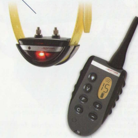
Cod. CA04E telecomando con 1 collare Cod. CR03E solo collare addestramento Cod. CR04E solo telecomando

Funzioni del telecomando con display LCD: • vibrazione per allertare il cane; • led ad alta luminosità; • 15 livelli di correzione; • stimolazione flash / continua; • tasti + e - per modificare il livello di stimolazione; • tasto BOOSTER con programmazione livello impulso per situazioni di emergenza; • dispositivo anti-shock che disabilita la stimolazione dopo 7 secondi.