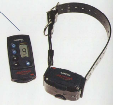
Cod. CA02 telecomando con 1 collare Cod. CR03 solo collare Cod. CR04 solo telecomando

CANICOM 200, come tutti gli altri modelli della gamma, è stato concepito con un occhio attento alle dimensioni e al peso. Dimensioni telecomando 98x45x18 mm, peso 50 gr. Dimensioni collare 68x43x38 mm, peso 75 gr.