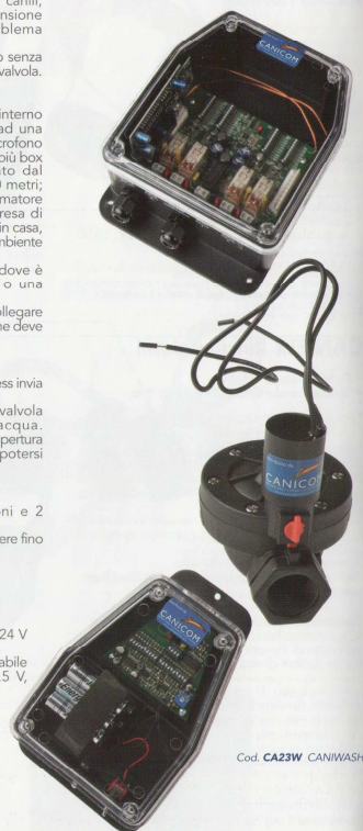
Cod. CA23W CANIWASH