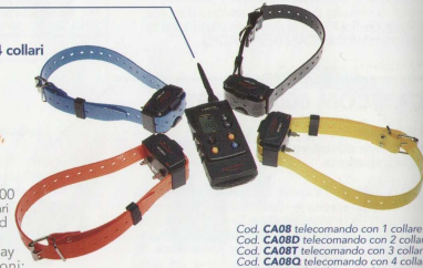
Cod. CA08 telecomando con 1 collare Cod. CA08D telecomando con 2 collari Cod. CA08T telecomando con 3 collari Cod. CA08R telecomando con 4 collari Cod. CR03 solo collare Cod. CR04B solo telecomando

Dimensioni telecomando 132x62x31 mm, peso 130 gr. Dimensioni collare 68x43x38 mm, peso 75 gr.