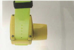
Cod. CA15 CANIBEEP PRO